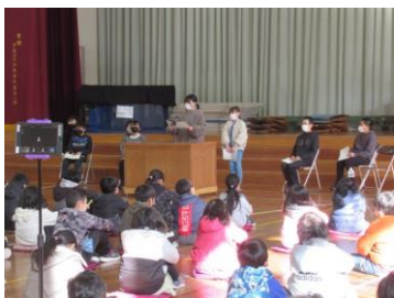
児童会立会い演説会 【3～6 年】