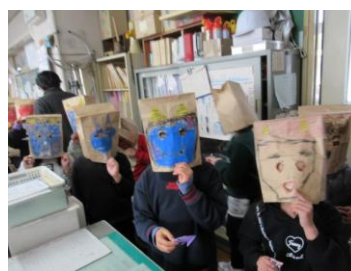
オニを追い払おう！ 【1 年】