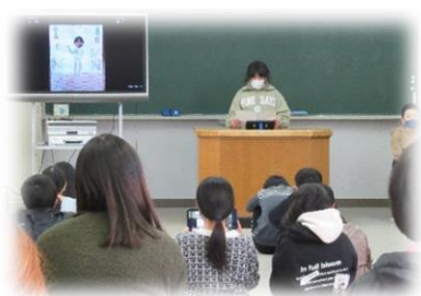
将来に向けた作文発表 【5 年】