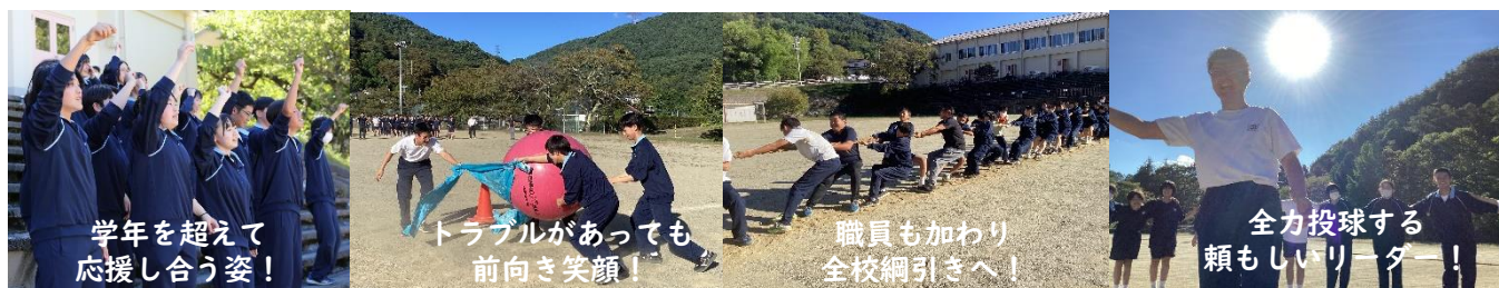
学年を超えて 応援し合う姿！

準備をしている段階で大変なこと、上手くいかないこと、ぎりぎりになってしまうことなど、たくさんあったけれど、無事成功してほんとによかった。自分たちの目標であった生徒会企画で全校が活躍できる場を設けて全校一人一人が活躍できている姿を見てよかったなと感じました。大変なことを乗り越えた先に見えてくるものってたくさんあるし、たくさんやりがいがあるなと思った。誰もが輝き、個性を放つことができた聖桜祭でした。(3年生)