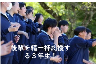
後輩を精一杯応援する3年生！

みなさん、楽しい時は本当にあっという間に過ぎ去っていきますね。一言でいうと「感動」と「充実」の聖桜祭でした。最後の3年生の学年合唱「信じる」に全てが現れていたと思います。今みなさんは、この聖桜祭2日間を創り上げるために、たくさんの時間を使い、たくさんの人とかかわり、たくさんの苦労や努力を重ねてきたことを改めて思い返しているのではないのでしょうか。クラス合唱や学年の出し物、委員会の仕事などがうまく進まなかったり、互いの気持ちが1つにまとまらなかったりして、どうしようかと悩み、時には嫌になってしまったこともあったのではないですか。