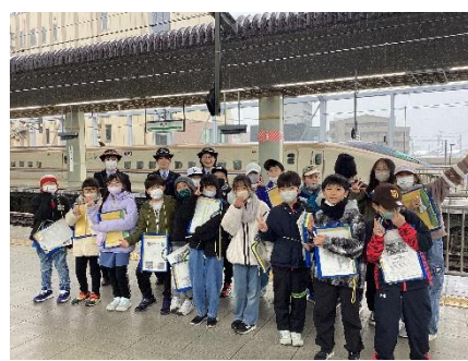
12/5 4年生は長野見学に行きました。県庁や善光寺、長野駅では新幹線乗り場で発着の様子を見学しました。