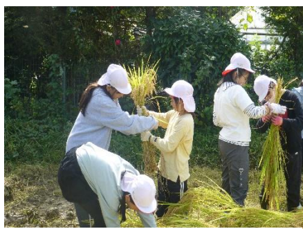
5年生は大きく育った稲を収穫しました。親子レクでは、そのお米でおにぎりや炊き込みご飯を使って、おいしくいただきました。