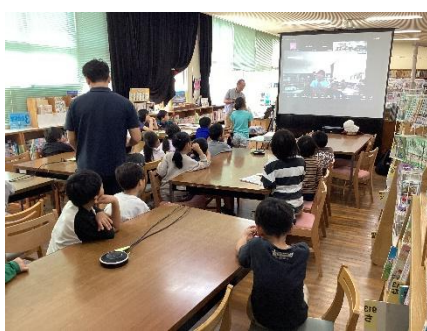
2年生は長谷小・高遠北小・高遠小の3校で本の紹介をしました。Zoomで互いのお勧め本を紹介し合い交流をしました。