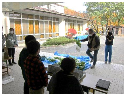
オープン学級では参観日に自分たちが育てた大根などの作物の販売を行いました。かわいい店員さんたちの接客の様子です。