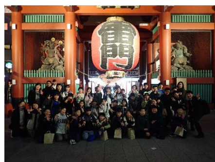
11/6・7 6年生は東京へ修学旅行に行ってきました。国会・東京藝大・科博・東京タワーなど秋の東京を満喫してきました。