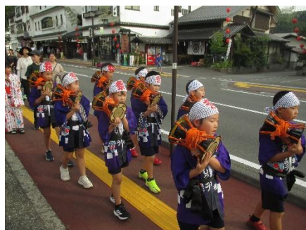
お囃子クラブの皆さんは、城下まつり、燈籠祭り、伊澤修二記念音楽祭、本校の音楽会と大活躍でした。