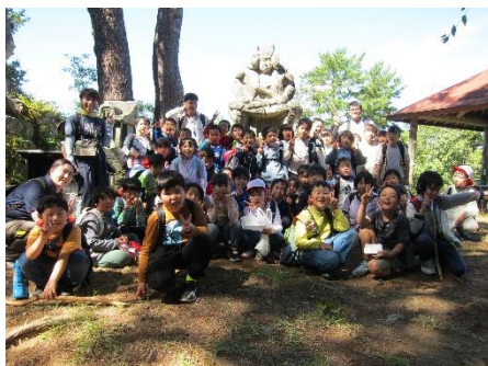
9/26 1・2年生は五郎山に遠足でかけました。初めての1年生を優しくリードする2年生の姿が見られました。