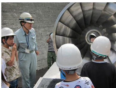
3年生は高遠地区にある公共施設の見学に出かけました。写真は美和ダムの水力発電所で説明を受けているところです。

本日で、2学期が終了しました。様々な学校行事や各学年の行事、そして日々の学習を通して、大きく成長し、また一步、学校教育目標「清らかで美しくやさしくたくましい高遠の子ら」に近づいた子どもたちです。保護者の皆様には、2学期も様々な面でご協力をいただきありがとうございました。また、地域の皆様には、本校の教育活動へのご支援・ご協力を賜り、ありがとうございました。行事や学習活動の一端をご紹介します。