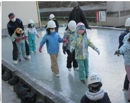
1年生のスケートの様子(校舎の窓から) お散歩に来た北保育園の皆さん 2年生はさすが!上手です!