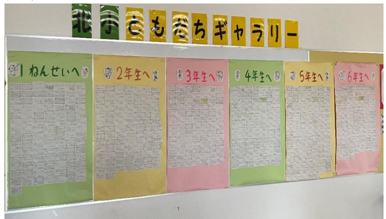
*音楽会の感想をメッセージカードで交換し合いました