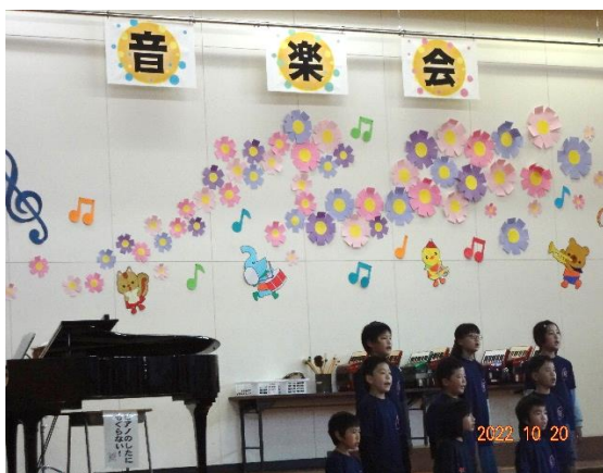
*心を一つに 音楽会の様子

11月22日にマラソン大会が予定されています。毎日走り続けている友だちがいます。すばらしい姿だと思います。「続けると力になります」がんばりましょう。