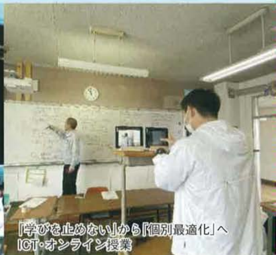
「学びを止めない」から「個別最適化」へ ICT・オンライン授業