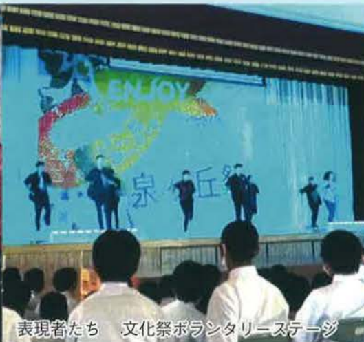
表現者たち 文化祭ボランティアステージ