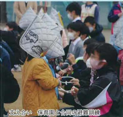
支え合い 保育園と合同の避難訓練