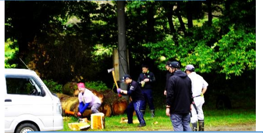
新割り講座開講！力強く割っていただいた薪を運び、薪小屋へ。