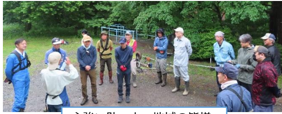
心強い助っ人、地域の皆様。