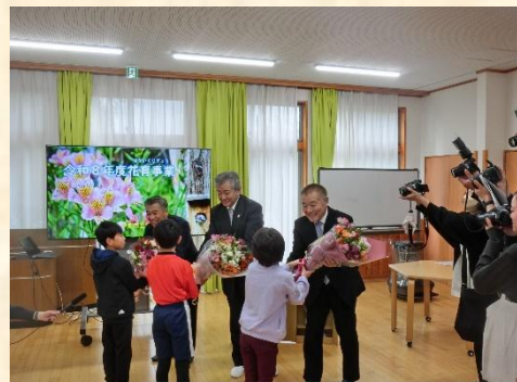
0508 3年生 花束贈呈式