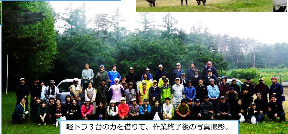
軽トラ3台の力を借りて、作業終了後の写真撮影。

今回参加していただいた地域の皆様は以下の通りです。(受付記入順)本当にありがとうございました。