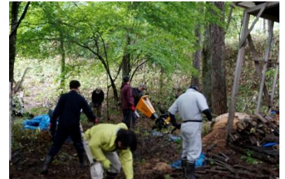
木切れをチッパーで森にお返し…。