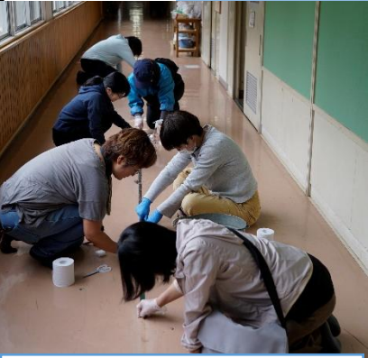
廊下のテーブルはがし。なかなか強力で手ごわかったけど、粘り強くやってくださいました。