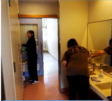
毎日お世話になるおトイレ。明日からより気持ちよく安心して使えます！