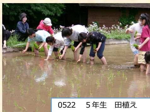
0522 5年生 田植え