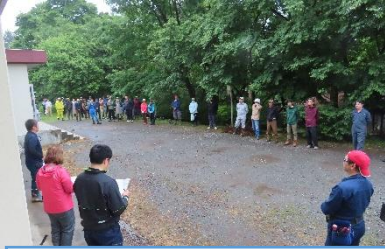
始めの会。大勢お集まりいただき大きな輪(和)ができました。

小雨がハラハラ舞う中でしたが、PTA作業を予定通り終えることができました。たくさんの保護者の皆様、地域の皆様にお越しいただき、学校内外の環境をあちこち整えていただきました。