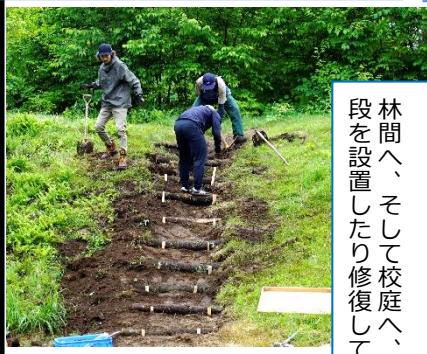
林間へ、そして校庭へ、とつても行き来しやすい階段を設置したり修復していただきました！