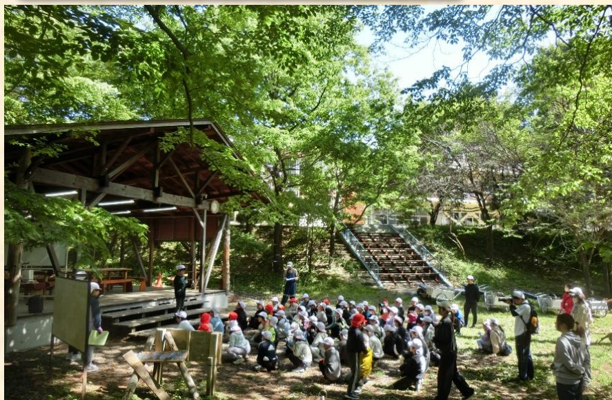
0515林間整備 縦割り班で協力し整備。森がより輝きました！