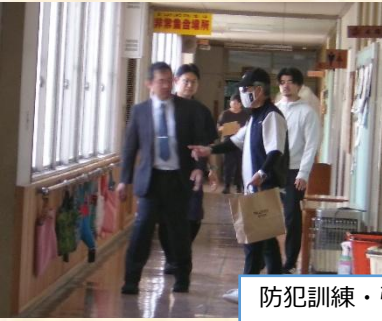
防犯訓練・引き渡し訓練