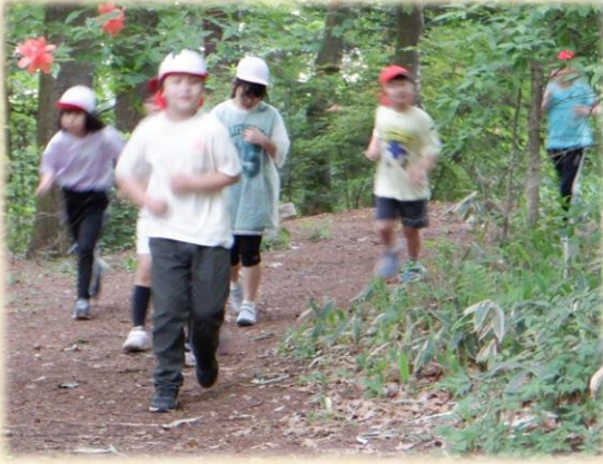
【春のマラソン記録会 5/22】

自分の持てる力を精一杯出し切って走る姿はこんなにも力強く美しく、ただただ感動します。