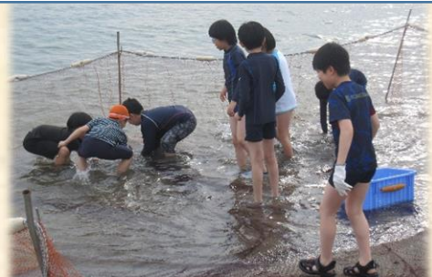
【5年 臨海学習 6/11～6/12】

安全な道路の歩行や自転車の乗り方について、交通安全センター・警察・安協の方々に協力いただき、実際に体験を通して学びました。