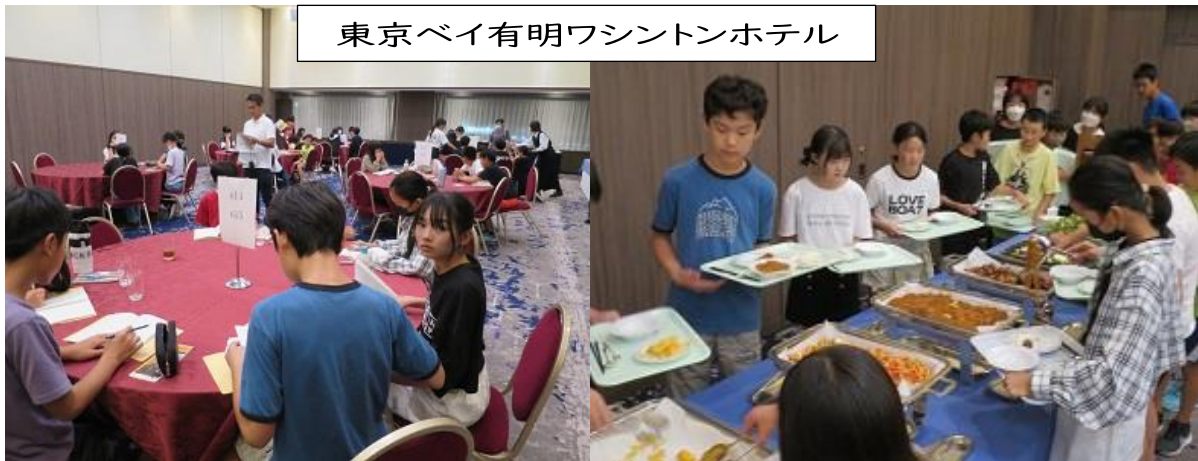
東京ベイ有明ワシントンホテル