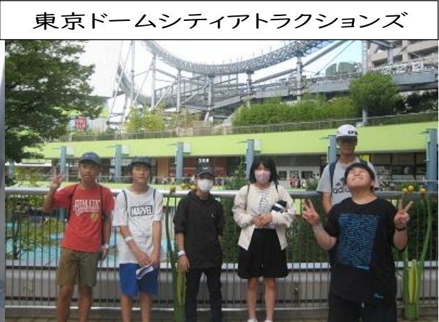
東京ドームシティアトラクションズ