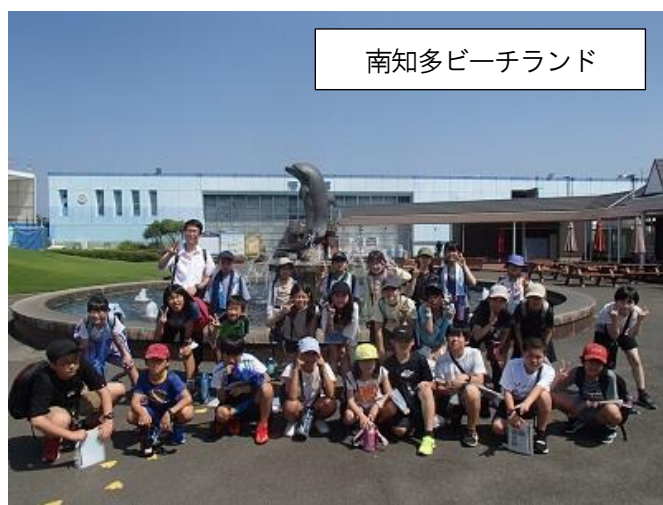
南知多ビーチランド