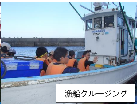
漁船クルージング