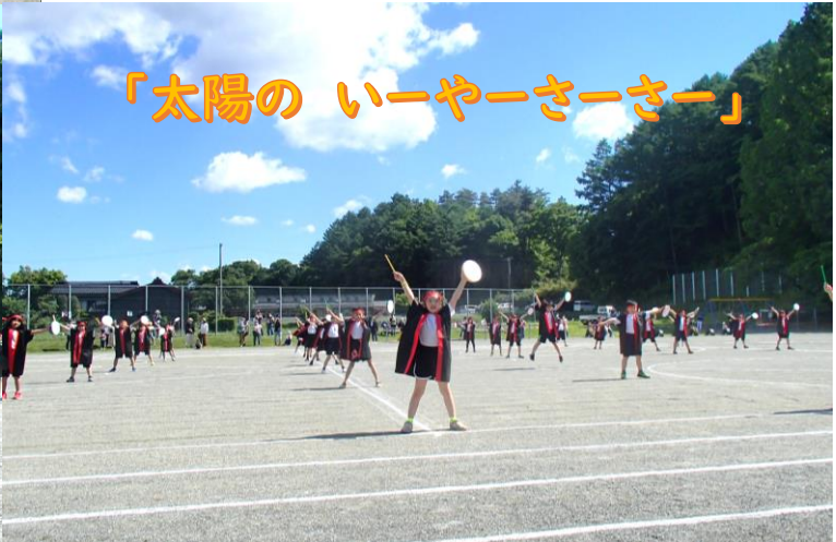
「太陽の いーやーさーさー」