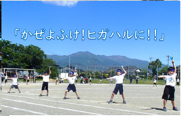
「かぜよふけ!ヒガハルに!!」