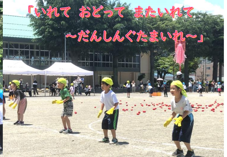
「いれて おどって またいれて ～だんしんぐたまいれ～」