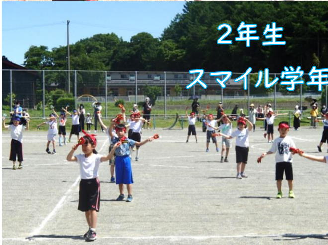
2年生 スマイル学年