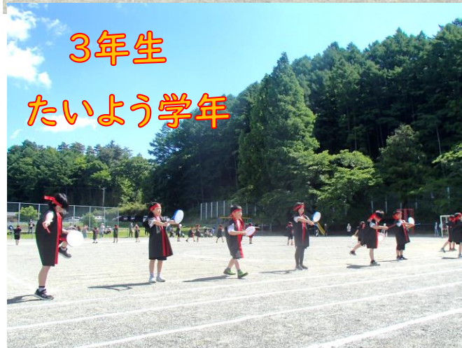
3年生 たいよう学年