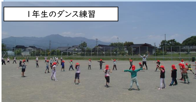
1年生のダンス練習

どの学年も練習に力が入っています。今年度も新型コロナウイルスの感染防止のため、様々な対策をとっての実施となります。大変心苦しいところではございますが、何卒ご理解の上、ご協力をお願いいたします。急な変更等はメールにてお知らせします。