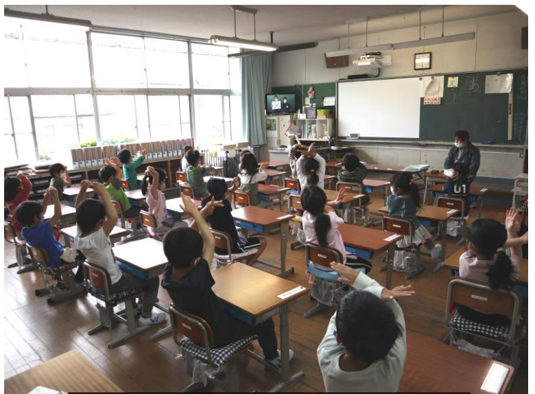
教室で○×クイズを楽しむ1年生